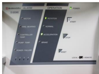
スタート時操作盤アラーム無