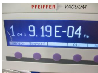
ノーマル切り替わり時圧力